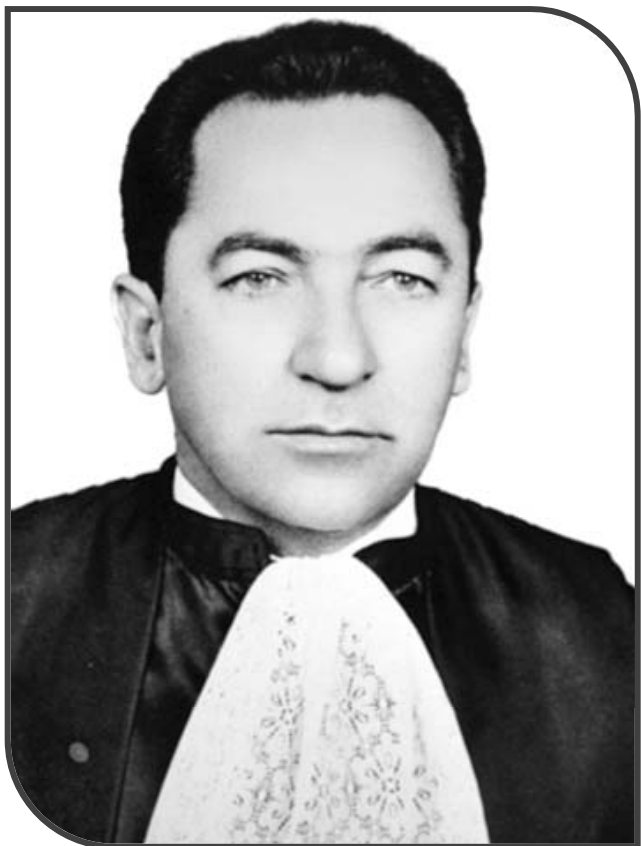
Ministro Garcia Vieira