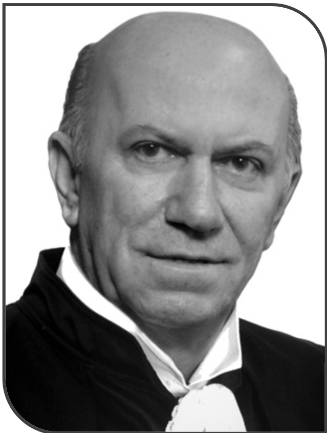
Ministro Castro Filho