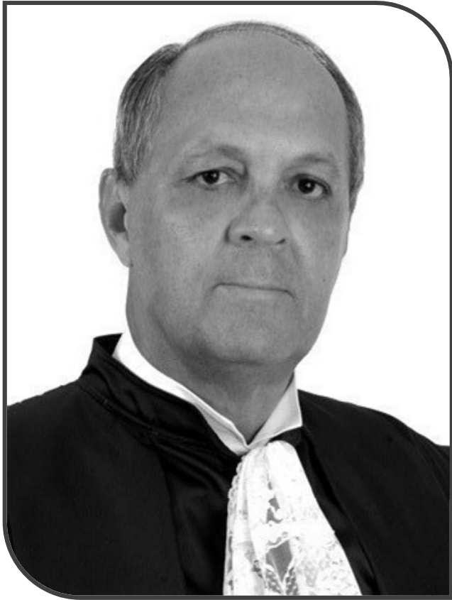
Ministro Menezes Direito