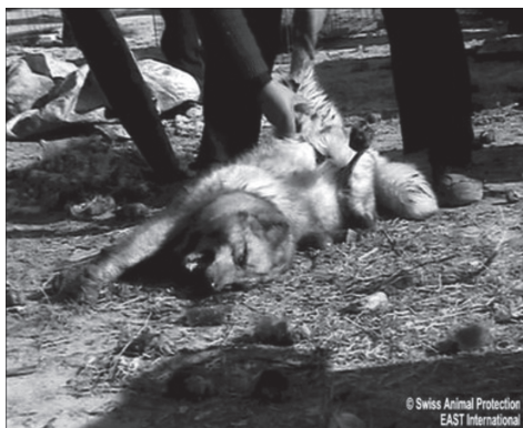
Atualmente, a Swiss Animal Protection (S.A.P.) denunciou as más-condições dos animais e a crueldade dos abates nas fazendas de pele existentes na China.