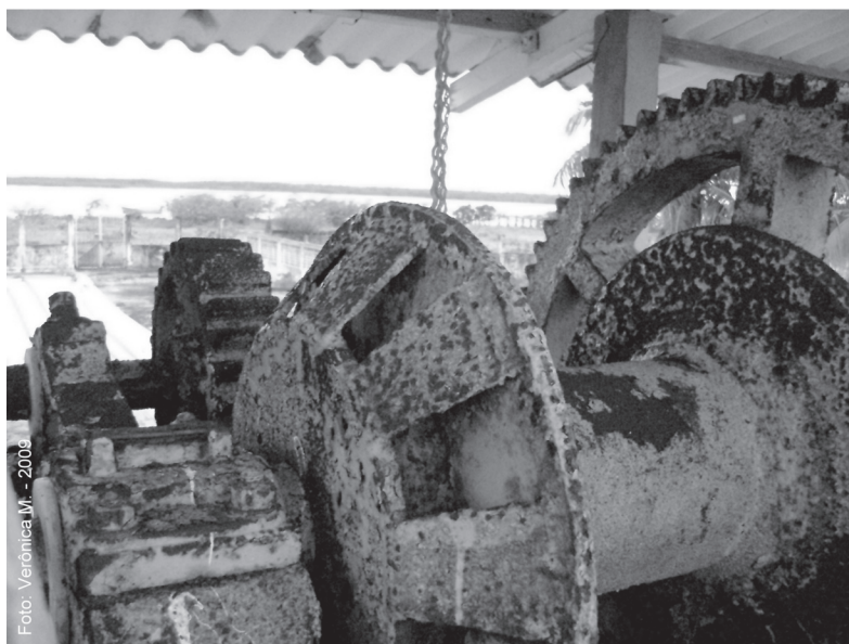
Antigo maquinário utilizado para puxar as baleias à plataforma de retalhamento da COPESBRA, em Lucena/PB.

SUMÁRIO: 1. Introdução; 2. Nossas irmãs desconhecidas; 3. Retrospectiva da crueldade; 4. Massacre na Paraíba; 5. A Lei dos Cetáceos; 6. Conclusões; 7. Referências.