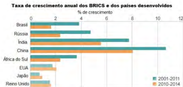
Tabela 1 – Taxa de Crescimento Anual dos BRICS

Fonte: International Monetary Fund. World Economic Outlook 32 .