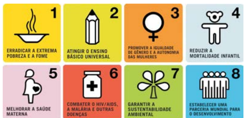
Figura 1 – 8 Jeitos de mudar o mundo.