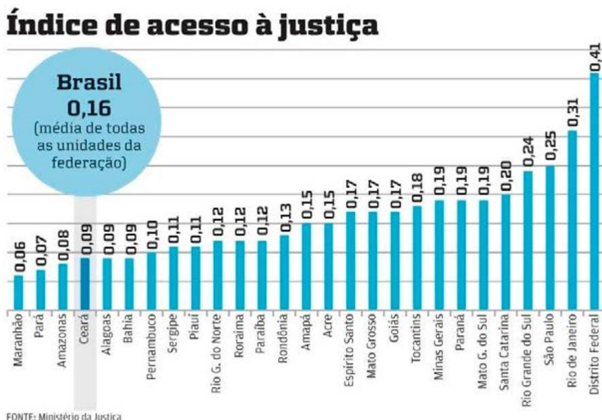
Figura 3: Índice de acesso à Justiça.

Estados apresentam índices abaixo da média, à exceção de Tocantins.