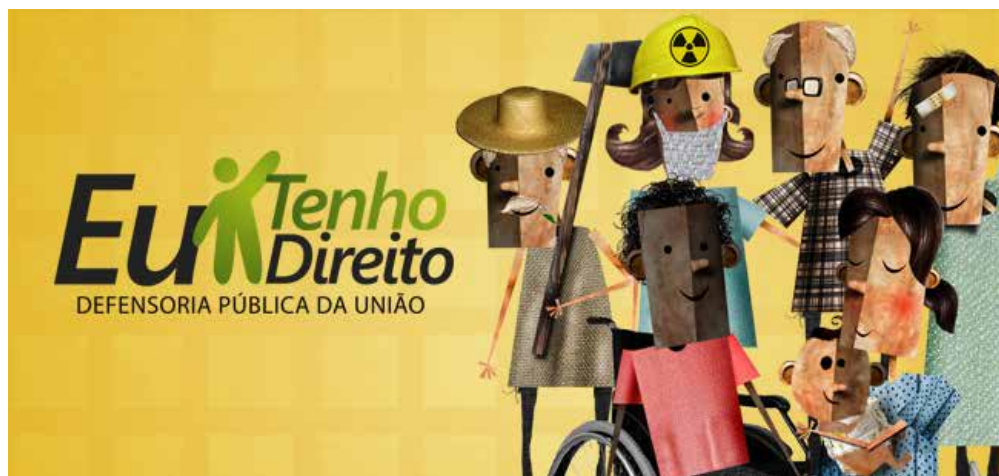
Figura 01 – Representação do público assistido pela DPU