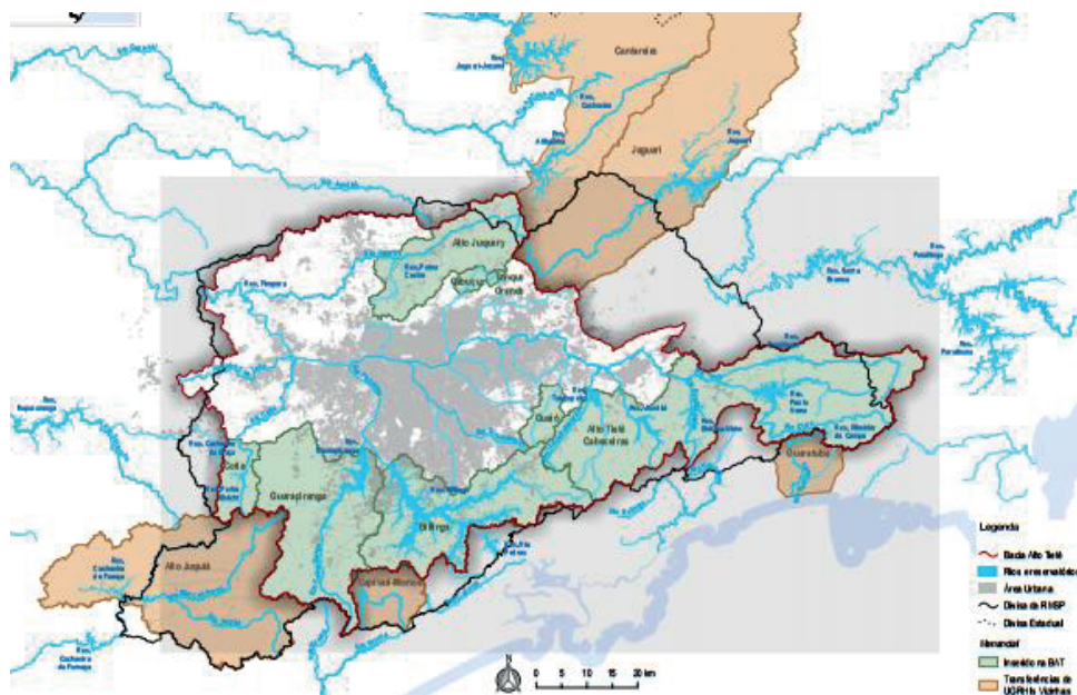
Figura 1 – Mananciais de interesse para abastecimento da RMSP