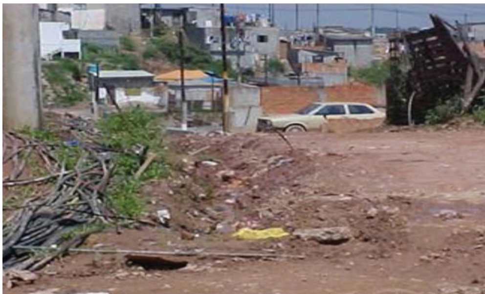
Figura 2 Exemplo de Conexões Irregulares

Um segundo caso não se refere a amplas glebas mas a ocupações com algum tipo de irregularidade – um número mais limitado de residências, muitas vezes vizinho a áreas regulares (ou por elas rodeado), servidas por sistemas públicos de infraestrutura. Para essa tipologia de situação, estimativa de 2016, produzida por levantamentos de campo, indicou um número aproximado a 300 mil imóveis na área de operação da Sabesp na Região Metropolitana de São Paulo. Considerando uma média de 3,5 pessoas por domicílio, temos cerca de 1,05 milhão de moradores, ou 5% da população metropolitana, utilizando-se de conexões irregulares, com os mesmos riscos que ameaçam as populações concentradas em bairros maiores e mais definidos. Para esses casos, em acordo com Prefeituras, a Sabesp desenvolve o Programa Água Legal, que combina um trabalho social de aproximação e de persuasão das famílias e, em seguida, a execução de ligações regulares e o enquadramento dos imóveis no padrão de tarifa social. Cerca de 78 mil imóveis, até agora, foram beneficiados pelo Programa. Entretanto, dificilmente o objetivo do Programa – a regularização de todos os imóveis – será obtido em prazo certo e linear, sem maiores percalços. O número de 300 mil imóveis não é fixo e as condições de estímulo à irregularidade, pelo menos os efeitos da crise de desemprego, permanecem. Além disso, há áreas de mais difícil abordagem, onde a presença do Estado é pouca e a presença de grupos à margem da lei é saliente.