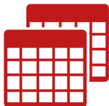
Tabela de petições incidentais

O envio de uma petição inicial requer a correta identificação das partes , com o número de CPF. Excepcionalmente, o cadastro poderá ser feito pelo nome da parte. Para isso, posicione o cursor no campo "Nome da Parte", digite o nome e selecione "sim" na opção "cadastrar sem CPF".