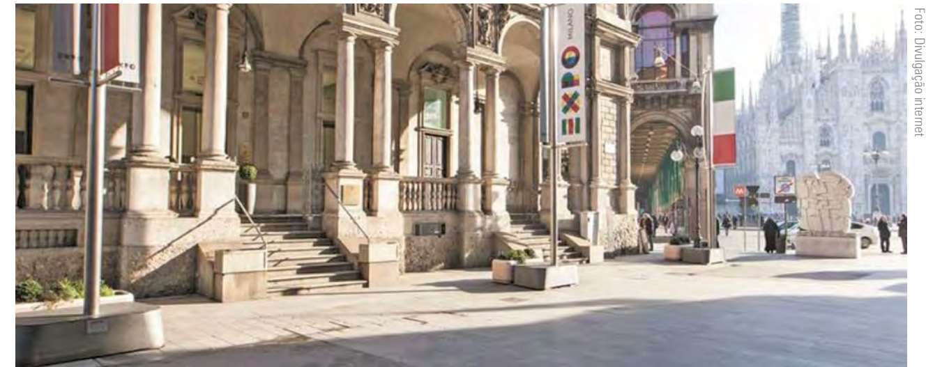
Palazzo F. Turati, sede da Camera di Commercio di Milano e da relativa câmara arbitral

Em 2017, algumas propostas normativas em tema de arbitragem foram elaboradas pela assim chamada Comissão Guido Alpa 5 , presidida pelo renomado jurista e nomeada pelo Ministério da Justiça italiano. Entre tais propostas, salienta-se, pela pertinência com a arbitragem internacional, a introdução da possibilidade de um “recurso per saltum ” à Corte Suprema de Cassação italiana nos casos de ação anulatória para a impugnação do laudo arbitral inválido ex lege (sem necessidade de transitar pelo segundo grau de juízo, que tem competência originária para a eventual ação de anulação), e a extensão dos poderes do árbitro de conceder medidas cautelares em caso de arbitragem administrada, antes