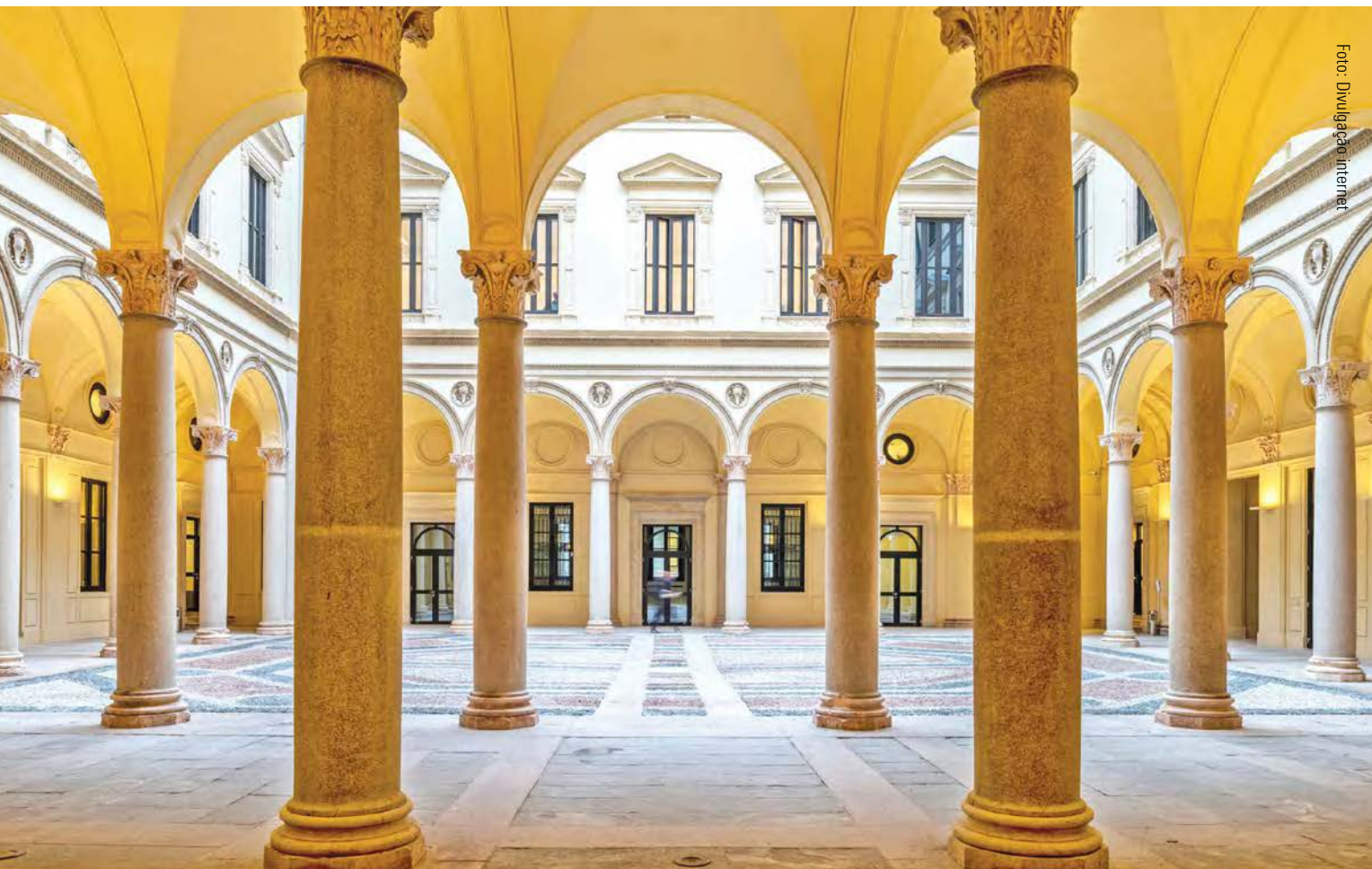
Pátio interno do Palazzo F. Turati