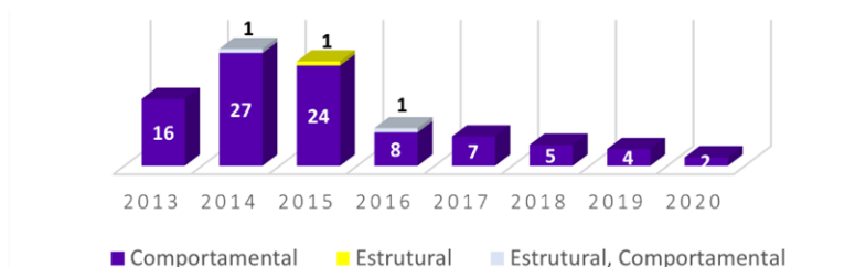
Gráfico 1 - Processos em que foram aplicadas medidas não pecuniárias e os tipos de medidas aplicadas