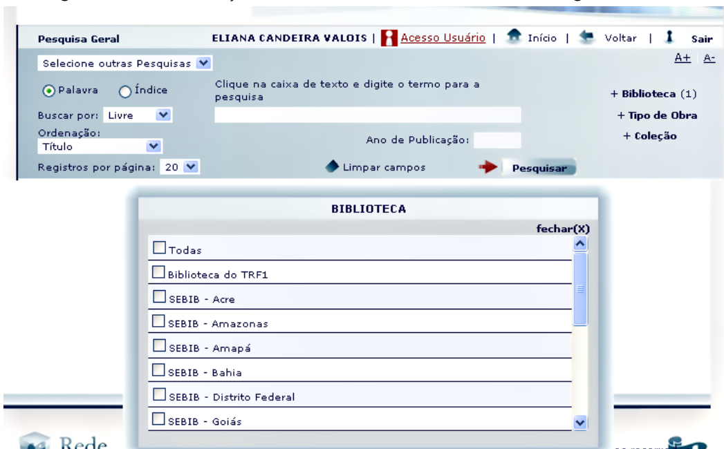
Figura 2 - Tela de seleção da biblioteca do sistema do TRF 1ª Região