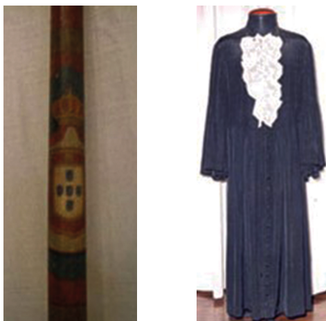
Figura 2 - A vara de juiz ordinário e a toga do magistrado