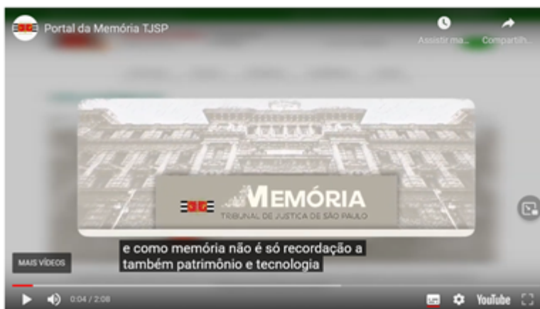
Figura - Vídeo de apresentação do Portal da Memória TJSP.

Fonte: Portal da Memória - Tribunal de Justiça de São Paulo, seção Memória da Magistratura. Disponível em: https://bit.ly/3GzGPXw .