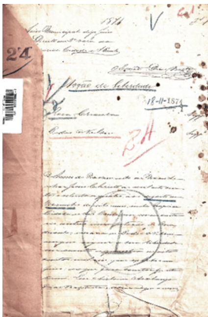
Figura 3 - Processo com texto escrito à mão