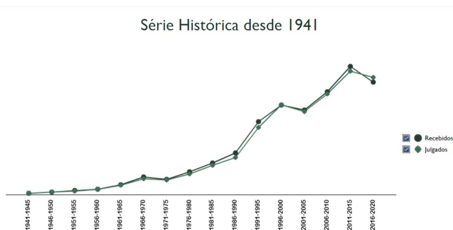
Figura 3 -Série histórica desde 1941.

Ocorre que, como menciona Bitencourt (2012, p. 122), a própria Constituição deixou margem para a adoção de determinados modelos políticos e econômicos que apresentam reflexos diretos nos direitos sociais. E, a garantia de direitos sociais demanda disposição de solidariedade, o que esbarra das ideias individualistas e de meritocracia. A título de exemplo, pode-se observar o gráfico abaixo sobre o recebimento e julgamento de ações na Justiça do Trabalho, desde 1941, e que demonstra queda após a reforma trabalhista no ano de 2017: