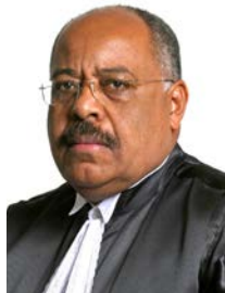
Ministro Benedito Gonçalves