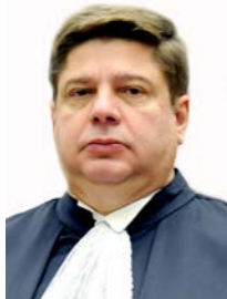
Ministro Raul Araújo