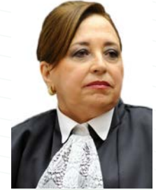
Ministra Assusete Magalhães