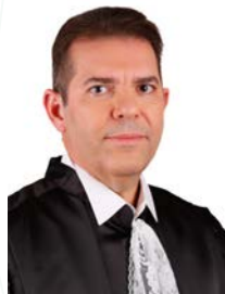
Ministro Ribeiro Dantas