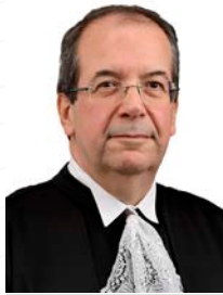
Ministro Villas Bôas Cueva