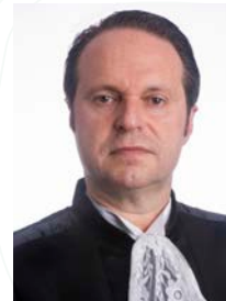
Ministro Joel Ilan Paciornik