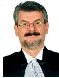
Ministro Marco Buzzi