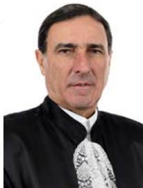
Ministro Moura Ribeiro