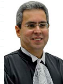
Ministro Gurgel de Faria