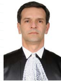
Ministro Marco Aurélio Bellizze