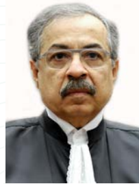
Ministro Og Fernandes