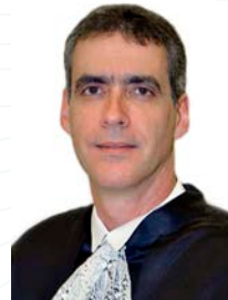
Ministro Rogerio Schietti Cruz