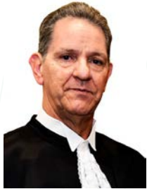
Ministro João Otávio de Noronha