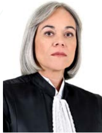
Ministra Maria Thereza de Assis Moura