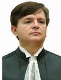
Ministro Herman Benjamin