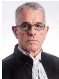
Ministro Antonio Saldanha Palheiro