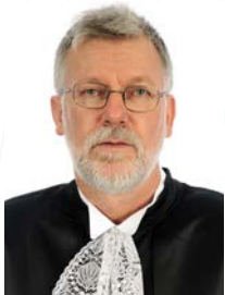
Ministro Sérgio Kukina