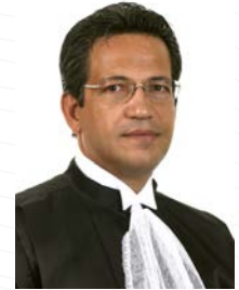
Ministro Mauro Campbell Marques