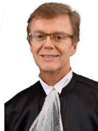
Ministro Paulo de Tarso Sanseverino