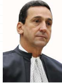
Ministro Francisco Falcão