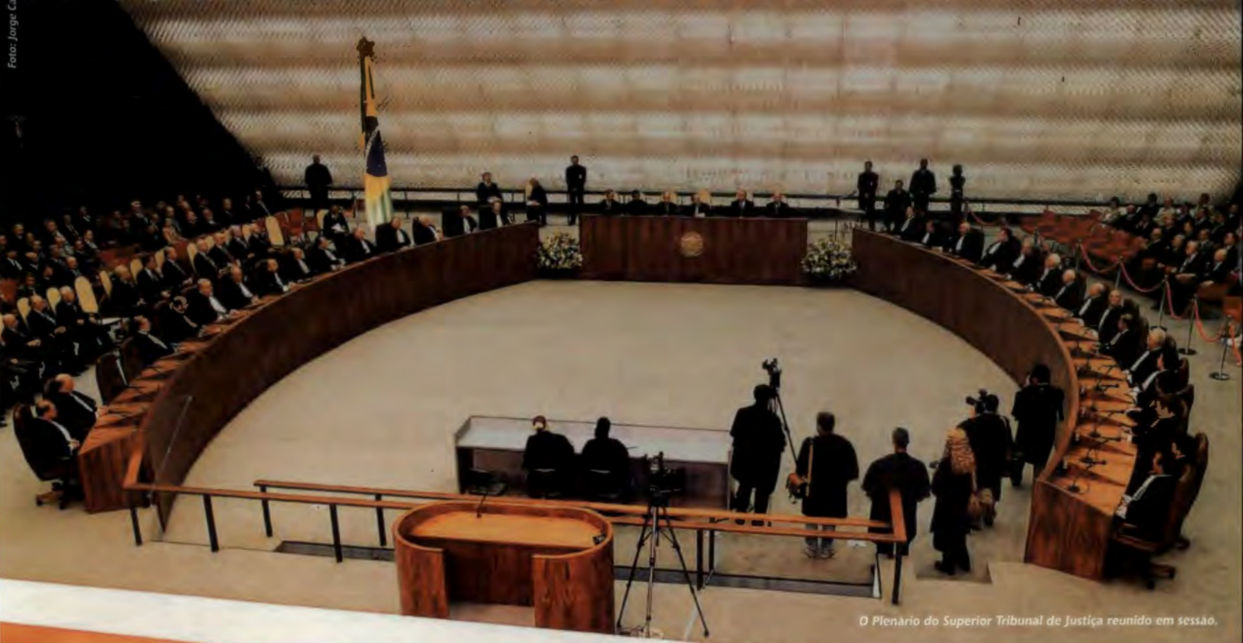
O Plenário do Superior Tribunal de Justiça reunido em sessão.

Projeto Gráfico: Núcleo de Programação Visual do STJ Criação: Carlos Figueiredo, Eduardo Lessa, Isabel Ramos, Leonel Laterza e Taís Villela Pesquisa de decisões e legendas: Deuza Lopes, Luciana Assunção e Regina Célia Amaral/Assessoria de Imprensa do STJ Fonte das fases da lua: CNPq - Observatório Nacional