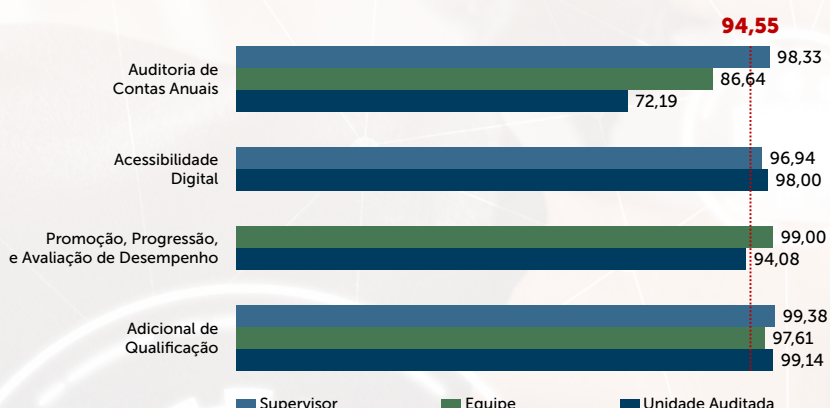
Gráfico 2: Resultado do IGAC por Auditoria e Tipo de Respondente

Gráfico 2: O gráfico apresenta os índices de avaliação proferidos pela equipe de auditoria, pelo supervisor e pelas unidades auditadas, para cada auditoria. Entre os valores alcançados, no que se refere à Auditoria de Contas Anuais, observam-se avaliações bem distintas entre supervisores (98,33 pontos), equipe de auditoria (86,64 pontos) e unidades auditadas (72,19 pontos). Isso demonstra que, na visão dos supervisores, o processo deveria ser avaliado no Nível 5 – Avançado; na visão da equipe de auditoria, no Nível 4 – Progressivo; e, na visão das unidades auditadas, no Nível 3 – Estabilizado. Essa divergência de avaliação indica que ainda há necessidade de aperfeiçoamento do processo de auditoria das contas do STJ. Assim como no primeiro gráfico, os índices alcançados são comparados ao IGAC médio das auditorias avaliadas no semestre.