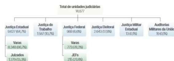
Figura 2. Total de unidades judiciárias em 2018

O judiciário tem, só em primeiro grau de jurisdição, 14.877 unidades. Esse número é a somatória de todas as unidades levando em conta as estaduais, eleitorais, trabalhistas, entre outras.