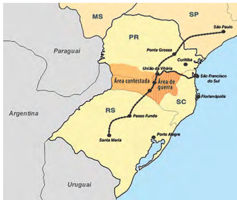
FIGURA 3 - Rota da estrada de Ferro São Paulo-Rio Grande.

Nas palavras de Lima e Tonon (2016, p. 182), em seus 4 anos de duração (1912-1916), o conflito envolveu uma área de 25 mil a 48 mil quilômetros quadrados, um efetivo militar de 8 mil homens somados à participação de mil “vaqueanos”, pessoas contratadas para trabalhar em prol do governo no combate aos caboclos, podendo-se dizer, mercenários. Os sertanejos chegaram a somar em torno de 10 mil homens, distribuídos em redutos.