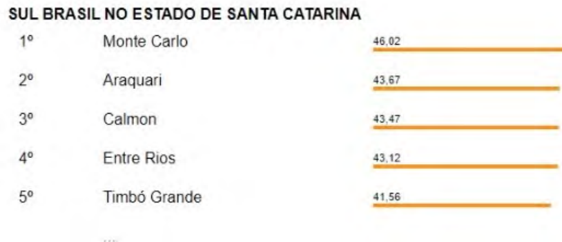
FIGURA 4 – Índice de pobreza em Santa Catarina.