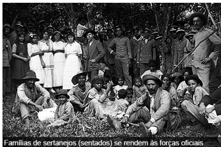
Famílias de sertanejos (sentados) se rendem às forças oficiais

SERPA (2015), afirma que os caboclos que habitavam a região eram tidos como uma população pobre que descendia de portugueses oriundos de São Paulo, Paraná, Rio Grande do Sul e ainda, de escravos afro-brasileiros. Não se pode deixar de lado a importância dos indígenas da região, os Xokleng e descendentes, que deixaram marcas de uma herança “mágico ritual” que persiste na região.