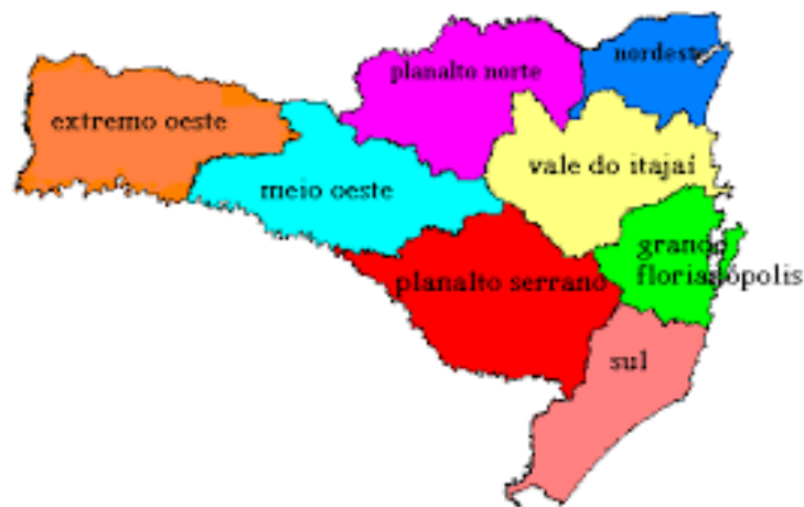
FIGURA 1 - Mapa do estado de Santa Catarina, dividido por regiões.

Algumas pessoas até lembram da cidade de Chapecó no oeste, em decorrência do time de futebol que passou por uma tragédia em 2016, mas eis que se apresenta o meio-oeste e o planalto norte na Figura 1: