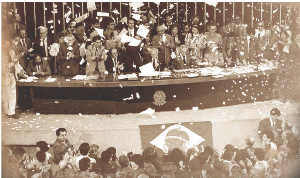
Foto 4 – Chuva de papel picado em plenário após a aprovação do texto Constitucional e o anúncio do fim dos trabalhos da Constituinte

A Constituição Federal, nos art. 104 e 105, definiu a composição e a competência original e recursal do STJ e estabeleceu o Conselho da Justiça Federal, funcionando junto ao Superior Tribunal de Justiça, cabendo-lhe exercer a supervisão administrativa e orçamentária da Justiça