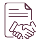
Compras e Contratos