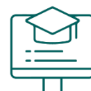
Sistemas de Apoio Comuns