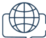
Linguagem e Idiomas