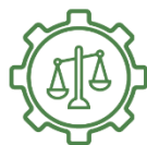
Governança e Gestão Judiciária