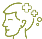
Cultura e Valores

Assim, para uma melhor organização, as ações educacionais estão divididas em dimensões, sendo elas: