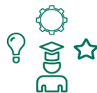
Educação e Desenvolvimento Profissional