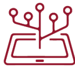
Tecnologia da Informação