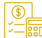
Orçamento e Finanças